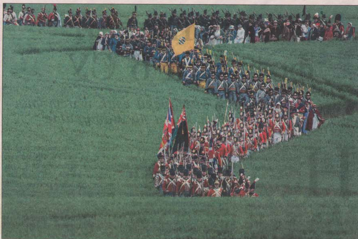
Този кадър на Методи Методиев печели специалната награда в конкурс за любителска фотография, посветен на 200 години от битката при Ватерло